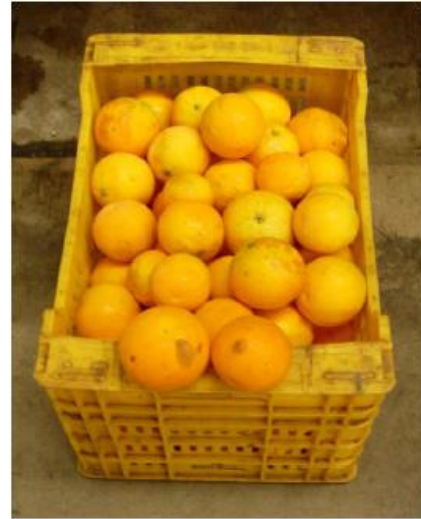
Senza fungicidi con ozono